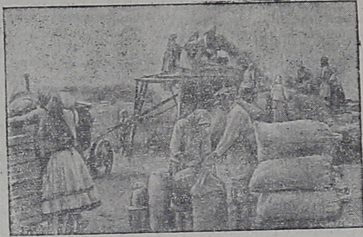
Прифронтная полоса Колхозницы колхоза „Новая жизнь“ быстро и организованно снимают урожай.