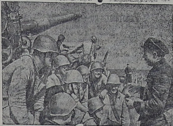
Героические защитники Одессы

Адрес редакции: КАЗАХСТАН. ИРТЫШСК. Карельского полка № 100 Заказ 245. Тираж 1043. Т. Б. 1383